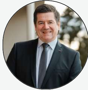
Bürgermeister Andreas Stangl

Aufgrund der noch ausstehenden Lohnverhandlungen liegt derzeit jedoch noch kein konkretes Angebot zur Kostenberechnung vor. Eine Ausschreibung erfolgt vor den Osterferien.