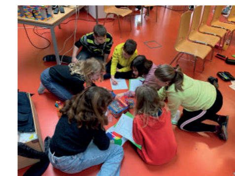
Die Kinder beim Experimentieren mit Lichtfarben