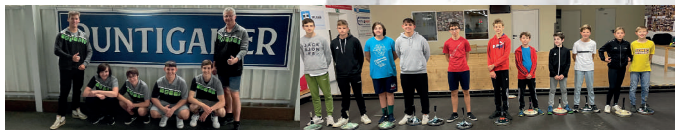
Jugend U16-Finale Landesmeisterschaften 8. Platz