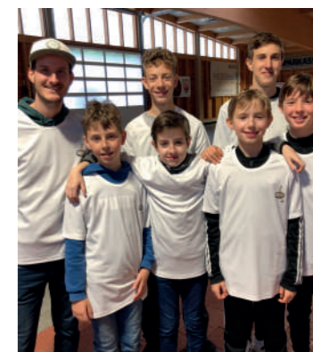
Landesmeisterschaft der Schulen BG/BRG Leibnitz 7. Platz