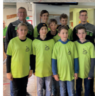
Jugend U14 -Vorrunde Landesmeisterschaft 3. Platz