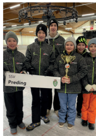
Wir sind Vize-Landesmeister!

Der gesamte Verein ist sehr stolz auf seine Jugend. Stock Heil Stocksportverein Preding