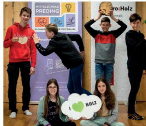
Die Schülerinnen und Schüler der MS Preding freuen sich schon auf den neuen Holz-Schwerpunkt!