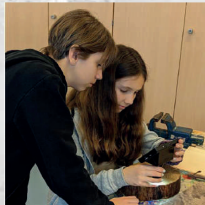
Das Forschen und Arbeiten rund um das Thema Wald & Holz prägt in der MS Preding ab nächstem Schuljahr den Schulalltag.