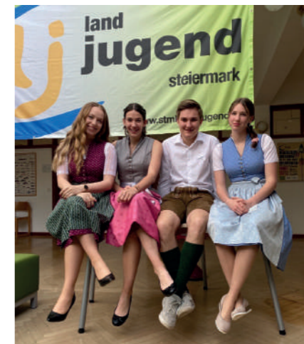
Unsere Redner vom Landesentscheid

Am 7. Mai ging der weltweit bekannte 10. Wings for Life World Run über die Bühne. Dieser Lauf wurde ins Leben gerufen, um mit Spenden die Rückenmarksforschung zu unterstützen- also zu laufen, für all jene, die nicht laufen können. Unsere Ortsgruppe war Teil des Teams der Landjugend Österreich und mit stolzen 7 Läufern mittels App von zuhause aus dabei. Wir sind stolz auf unsere Leistungen und freuen uns, nächstes Jahr wieder mit dabei zu sein!