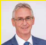
Dir. Josef Adam

Fragen Sie Ihren Berater nach Ihrer individuellen Wohnbaufinanzierung. Die MitarbeiterInnen der Raiffeisenbank Wildon-Preding freuen sich auf Ihren Besuch!