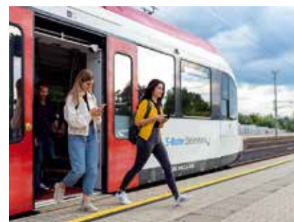
Die Koralmbahn bietet eine Vielzahl an Tickets für unterschiedliche Bedürfnisse. Pendler in der Steiermark können das KlimaTicket Steiermark nutzen, während Pendler nach Kärnten das KlimaTicket Österreich erwerben können. Für Gelegenheitsfahrer in ganz Österreich gibt es das Sparschiene-Ticket , und für den Freizeitverkehr steht das Freizeit Ticket Steiermark zur Verfügung.

Die Fahrzeiten vom Bahnhof Weststeiermark innerhalb Österreichs reduzieren sich zum Teil massiv: