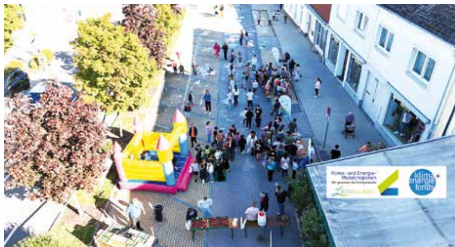
→ Der Neufelder Hauptplatz verwandelte sich in eine bunte Gemeinschaftszone.

Ein herzlicher Dank gilt den Kindern, die mit ihrer Begeisterung und ihrem künstlerischen Talent den Hauptplatz in ein Blumenmeer verwandelt haben. Ebenso danken wir der Stadtgemeinde Neufeld für die Unterstützung und allen Helfer:innen, die zum Gelingen dieser Veranstaltung beigetragen haben.