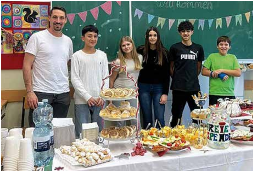
→ Top: das Angebot im Elterncafé beim Tag der offenen Tür in der MS Neufeld

Wir bedanken uns für das große Interesse und die freien Spenden im Elterncafé. Der Erlös kommt der Schule zugute. ♦