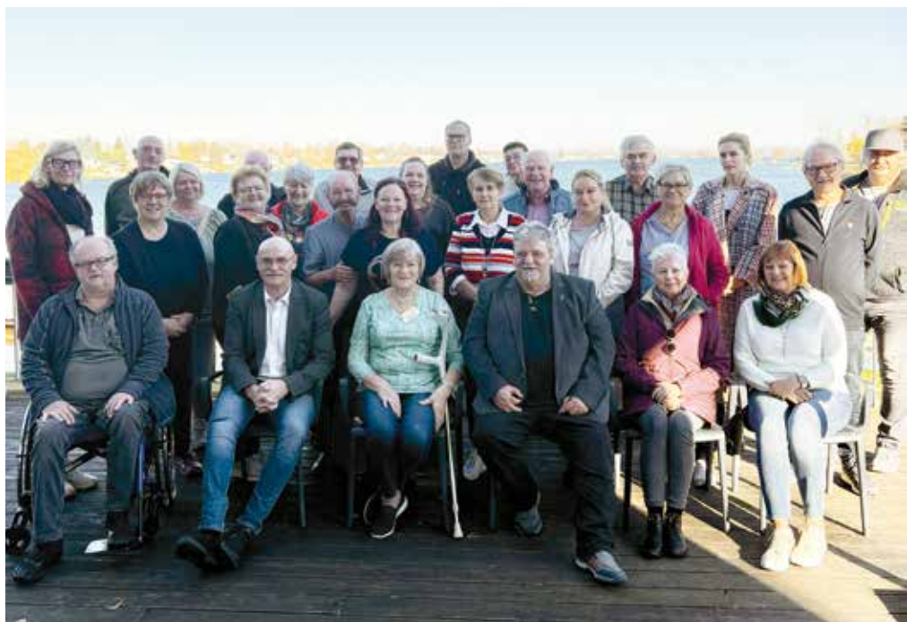
→ Teilnehmer:innen KOBV-Akademie im Seehotel und Restaurant Neufeldersee

Bekanntlich musste unser Erholungs- und Seminarhaus Schloss Freiland geschlossen werden. Die wirtschaftlichen Einschnitte durch die Einstellung von staatlichen Förderungen waren nicht mehr tragbar.