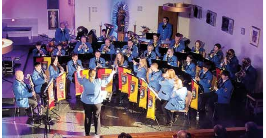
→ Viel Applaus gab's beim Konzert in der Kirche des Arbeitermusikvereins Neufeld.

Eine große Freude war es auch, dass wir sechs neue Kolleg:innen in unseren Reihen begrüßen konnten, die erstmals bei einem Konzert mitspielen durften. Das stimmungsvolle Ambiente der röm.-kath. Pfarrkirche