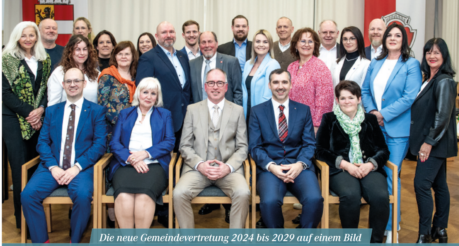
Die neue Gemeindevertretung 2024 bis 2029 auf einem Bild

In der Gemeindevorstehung (Stadtskollegium) sind neben den sieben Mitgliedern der SPÖ die ÖVP und die FPÖ mit jeweils einem Mitglied vertreten.