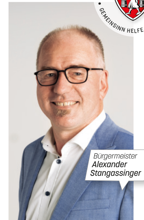
Bürgermeister Alexander Stangassinger