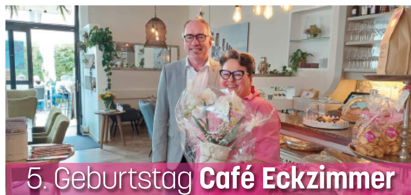
5. Geburtstag Café Eckzimmer

Weitere Informationen, sowie Förderungen für z.B. Photovoltaik-Errichtungen können auf der Homepage der Stadtgemeinde Hallein entnommen werden.