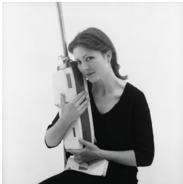
VALIE EXPORT, OHNE TITELANGABE, FRAU MIT STAUBSAUGER NACH: LUKAS CRANACH „MARIAHILF“, PASSAU, CA. 1537, 1976, S/W FOTOGRAFIE

ÖFFNUNGSZEITEN: DIENSTAG BIS SONNTAG 13 BIS 19 UHR