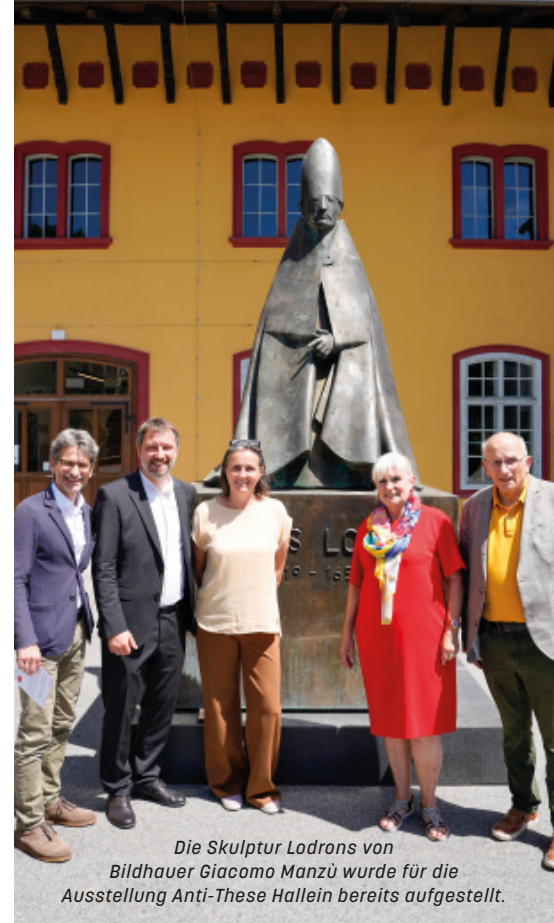
Die Skulptur Lodrons von Bildhauer Giacomo Manzù wurde für die Ausstellung Anti-These Hallein bereits aufgestellt.

ÖFFNUNGSZEITEN: MONTAG BIS SONNTAG 9 BIS 17 UHR