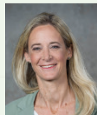
Kimble Humer-Vogl Fraktionsvorsitzende, Grüne