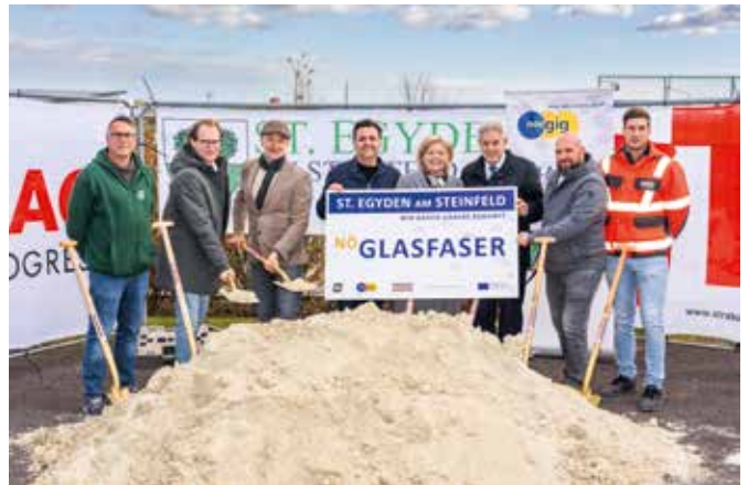
Spatenstich Glasfaserbau