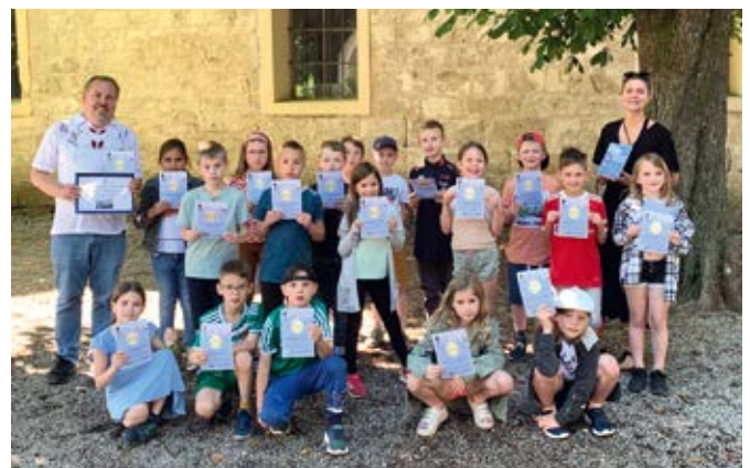
Die 2. Klasse der Volksschule St. Egidien freut sich über ihren bevorstehenden Ausflug in den Motorikpark in St. Corona und die Fahrt mit der Sommerrodelbahn.