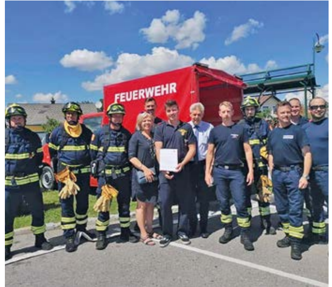
Präsentation der Waldbrandgruppe