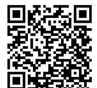
Wirtschaftsrunde erstmalig in Blindenmarkt