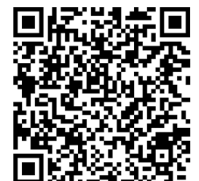
Projektcircus Montana in Blindenmarkt