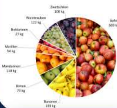
AMA Schulobstprogramm 2023/2024 NMS Blindenmarkt (Insgesamt 1.331 kg Obst)