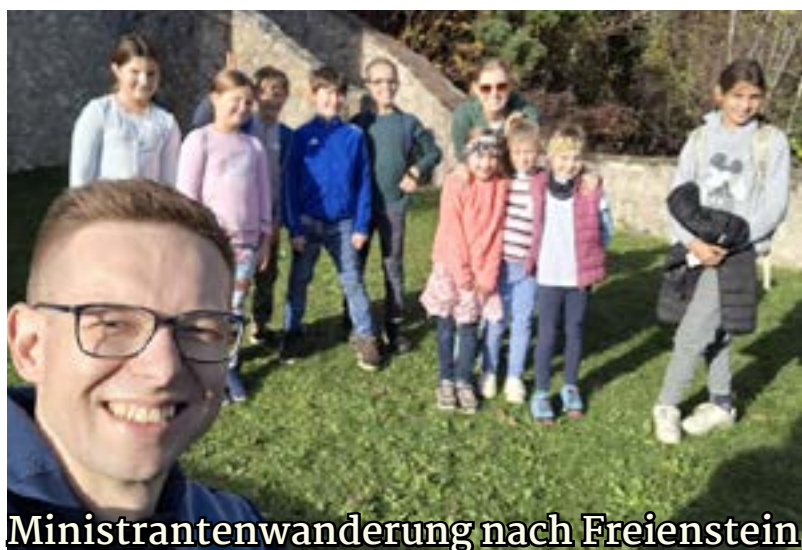
Ministrantenwanderung nach Freienstein