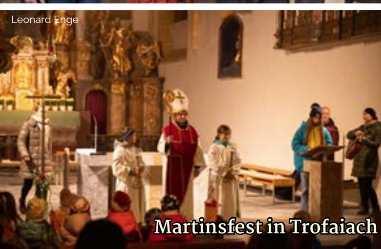
Martinsfest in Trofaiach