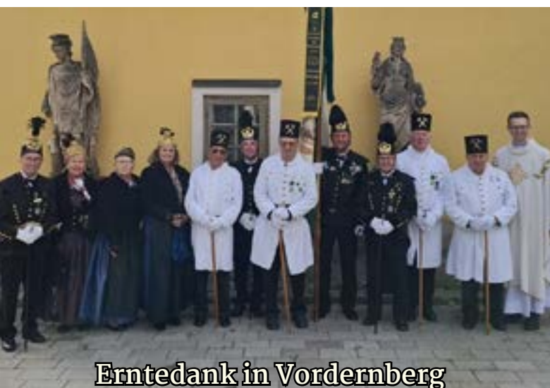
Erntedank in Vordernberg