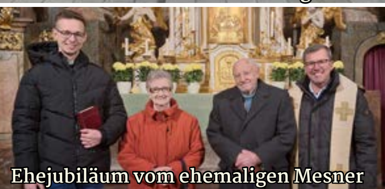
Ehejubiläum vom ehemaligen Mesner