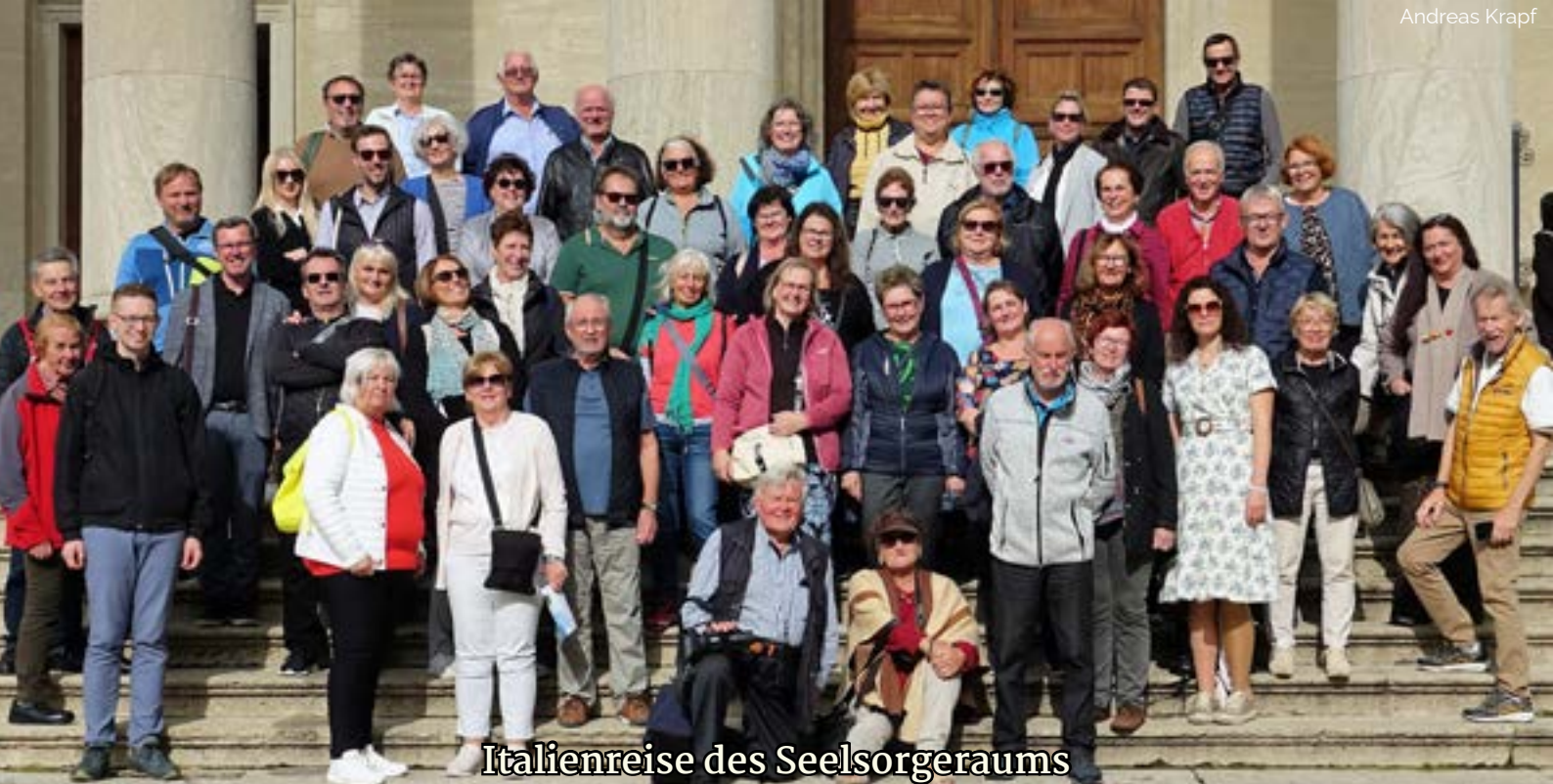
Italienreise des Seelsorgeraums