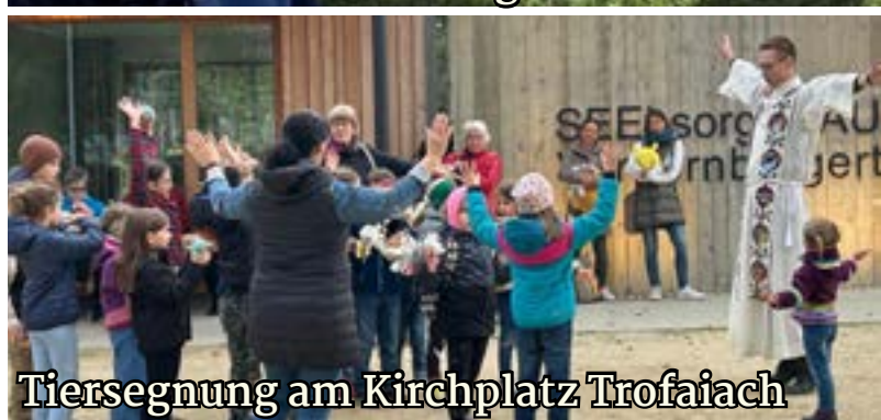
Tiersegnung am Kirchplatz Trofaiach