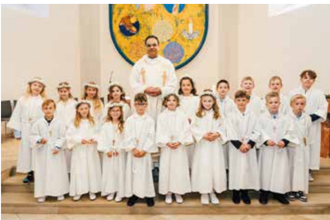
Erstkommunion zu Christi Himmelfahrt 18 Kinder aus unserer Pfarrgemeinde feierten ihre Erstkommunion in der Kirche.