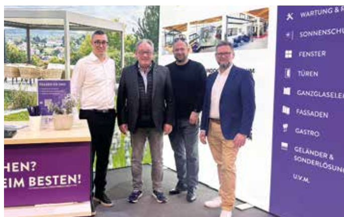
Beim Stand der Firma Sommer erfuhr man alles rund um Winter- und Sommergärten, Terrassendächer & Co