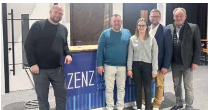
Die Firma Zenz präsentierte innovative Lösungen in den Bereichen Fenster, Türen und Tore