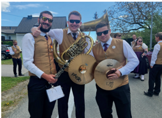
Text: Blasmusik Oberschützen/ Bad Tatzmannsdorf

alle sehr! Bei strahlendem Sonnenschein waren die diesjährigen Tage der Blasmusik ein voller Erfolg und sowohl das Publikum als auch die MusikerInnen haben die wunderschönen Tage genossen!