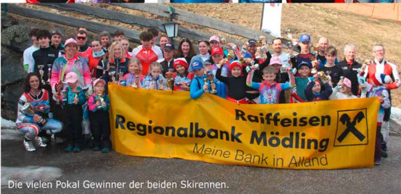
Die vielen Pokal Gewinner der beiden Skirennen.