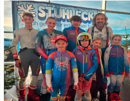
Gelungener Start in die Wintersaison

Der Ski Club Alland startete auch heuer wieder mit seinen Einfahr- und Trainingskursen erfolgreich in die neue Wintersaison. Beim Einfahrkurs in Obertauern fanden unsere Läuferinnen und Läufer bereits Ende November beste Bedingungen vor, um sicher und technisch sauber in den Winter zu starten.