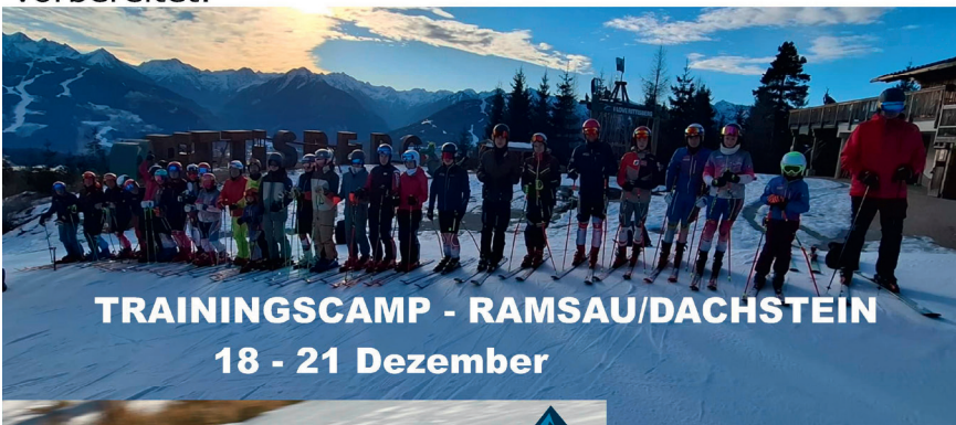
TRAININGSCAMP - RAMSAU/DACHSTEIN 18 - 21 Dezember

Beide Kurse waren sportlich sehr wertvoll und stärkten zudem den Teamgeist im Verein. Der Ski Club Alland ist damit bestens auf die kommende Rennsaison vorbereitet.