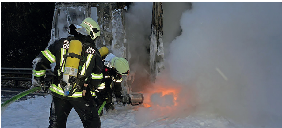
© Stefan Schneider BFWK Baden (1)