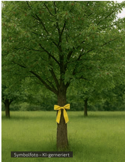
Symbolfoto – KI-generiert