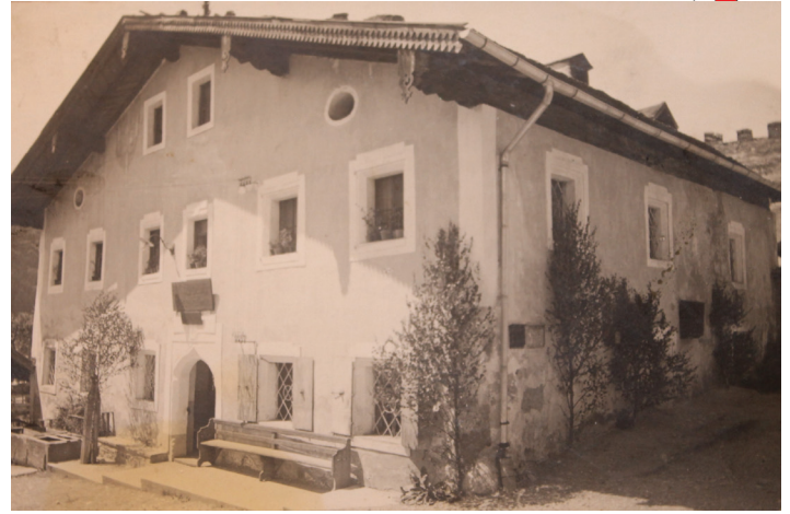
Bgm. Bernhard Weiß

Wir laden alle herzlich ein, sich in die weiteren Planungen und in die Ideenfindung einzubringen, damit der Pfarrwirt auch weiterhin das zentrale Haus im Ortszentrum von Pfarrwerfen bleibt, wo Geselligkeit und Zusammenleben viel Platz finden.