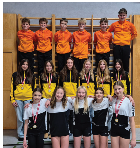
DMS VD OSR Dipl.-Päd.

Die betreuenden Lehrerinnen und Lehrer zeigten sich äußerst stolz auf die Leistungen ihrer Schützlinge und lobten den großen Einsatz sowie die intensive Vorbereitung. Der Wettkampf unterstrich einmal mehr den hohen Stellenwert des Turnsports an der Sportmittelschule Werfen.