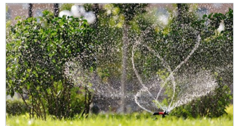
Hitzewellen lassen den Wasserverbrauch in die Höhe schnellen. Die Stadtgemeinde bittet die Bevölkerung, mit Trinkwasser nicht zu gießen und so sorgsam wie möglich damit umzugehen.

zichtet werden, damit Autos zu waschen, den Garten zu gießen oder den Pool nachzufüllen. Besitzer von Zisternen oder privaten Brunnen ist es natürlich jederzeit freigestellt, ihr Wasser für jegliche Bewässerungen zu verwenden. Die Mitarbeiter des Stadtservice verwenden zum Gießen der Pflanzen und Blumenarrangements im öffentlichen Bereich der Stadt ausschließlich Wasser aus einem eigenen Brunnen.