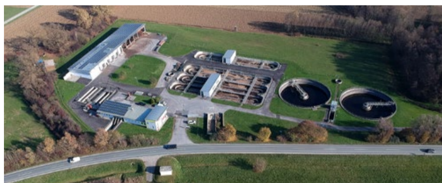
Gemeinsam mit dem Abwasserverband investiert die Stadtgemeinde in die Verbesserung der Infrastruktur.

Die technische Ausstattung der Anlage ist beeindruckend. Als einstufige Belebungsanlage konzipiert, nutzt diese die mo-