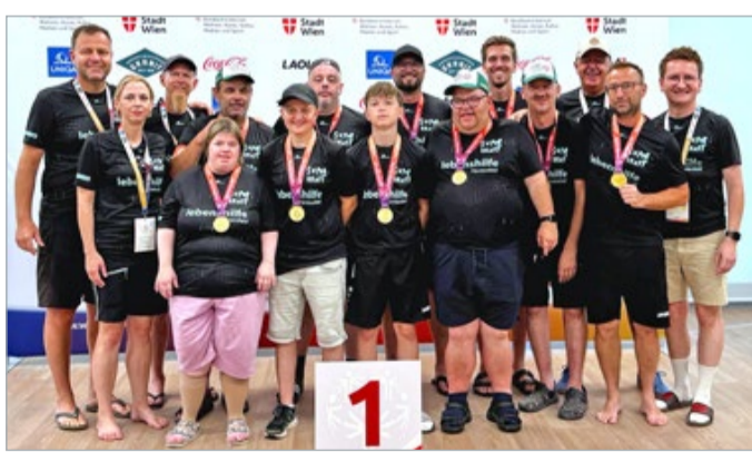
Das inklusive Fußballteam der Lebenshilfe gewann bei den Sommerspielen der Special Olympics Österreich in Wien im Unified-Fußballwettbewerb das Level 2-Turnier.

Das inklusive Fußballteam „Superkraft“ der Lebenshilfe Fürstenfeld nahm an den Sommerspielen 2026 der Special Olympics Österreich in Wien teil und gewann die Goldmedaille im „Unified-Fußballwettbewerb“ der Level-2-Wertung. Bei den Athletinnen und Athleten brach Jubel aus, große Freude herrschte beim gesamten Lebenshilfe-Team. Für den Bewerb wurde im Vorfeld fleißig trainiert und gemeinsam am großen Ziel gearbeitet. Beispielsweise trafen sich im Zuge des Projekts „Fußball für ALLE“ Kinder, Jugendliche, Fußballer und Nicht-Fuß-