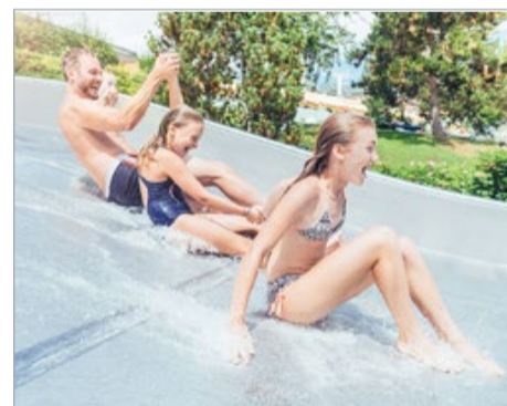
Im Thermenresort Loipersdorf nimmt der Sommer mit viel Spaß und Action für die gesamte Familie Fahrt auf. Attraktionen und Angebote gibt es bis 13. September.

Während der Woche sorgt das Animationsteam mit Programmpunkten wie „Rutschenraketen“,