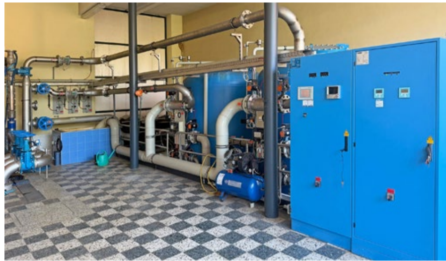
Schaltstelle der gesicherten Wasserversorgung der Bevölkerung der Stadtgemeinde ist das städtische Wasserwerk.

Die Stadtgemeinde blickt vorausschauend in die Zukunft, um künftige Generationen abzusichern. Im Vorjahr gab es eine umfassende Bestandsanalyse, auf deren Datengrundlage ein fundiertes Reinvestitions- und Modernisierungsprojekt erarbeitet wurde. Maßnahmen und die strategische Ausrichtung der Wasserversorgung sind definiert. Die ersten Schritte dieses mehrjährigen Vorhabens wurden gesetzt. Dazu zählen die Sanierung, Adaptierung und Modernisierung der bestehenden Anlagen sowie die Erweiterung der Versorgungsanlagen aufgrund des gestiegenen Bedarfs. Für die Modernisierung und Zukunftssicherung der Wasserversorgung sind Investitionen von rund 15 Millionen Euro vorgesehen. Damit zählt dieses Vorhaben zu den größten Infrastrukturprojekten in der Wasserversorgung der Stadtgemeinde Fürstenfeld der vergangenen Jahrzehnte.