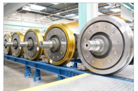
Im Siemens Mobility-Werk in Fürstenfeld werden unter anderem auch die Radsätze für Schienenfahrzeuge vormontiert.

„In Fürstenfeld entsteht erfolgreich moderne Mobilität made in Austria. Davon profitieren die Region, die heimische Wirtschaft und der klimafreundliche Ausbau des Verkehrs gleichermaßen“ stellte der Bundesminister für Mobilität Peter Hanke fest. Landeshauptmann Mario Kunasek verweist auf die Attraktivität des Standorts und die neuen Perspektiven für die Region. „Unternehmen investieren dort, wo sie Verlässlichkeit, Qualität und Kompetenz vorfinden – genau dafür steht die Steiermark“, ergänzte Landeshauptmann-Stellvertreterin Manuela Khom. Als aktiver Beitrag zur langfristigen Stärkung und Weiterentwicklung der Bahnindustrie in der Steiermark und in Österreich