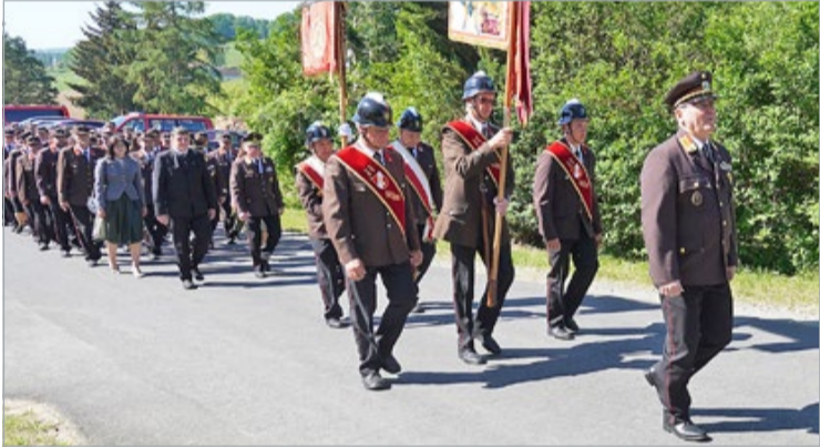
Die traditionelle Florianimesse der sechs Feuerwehren der Stadtgemeinde wurde von der Wehr Stadtbergen ausgerichtet. Die Abordnungen marschierten vom Rüsthaus zur Stelzerwirt-Halle.