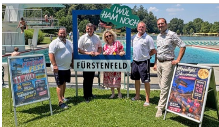
Das Freibad Fürstenerfeld wird am 11. Juli zur Festmeile mit Action und Partystimmung. Erstmals gibt es heuer ein Moonlight-Schwimmen am 31. Juli sowie am 7. und 14. August.

Am Samstag, 11. Juli feiert die Thermenhauptstadt beim zweiten Freibadfest am größten Swimmingpool Europas. Viel Spaß und beste Unterhaltung für die gesamte Familie sind dabei garantiert. Stadtgemeinde, Stadtmarketing und Stadtwerke Fürstenerfeld laden zu einer bunten Programmfülle und am Abend ab 19 Uhr zu einer ausgelassenen Party mit der Band „Egon7“ am Freibadgelände. Für Kulinarik und kühle Getränke sorgen das Restaurant „Moana“ und diverse Stände. Auf die Gäste warten zahlreiche Höhepunkte bei gratis Eintritt den ganzen Tag über und mit lediglich fünf Euro Eintritt ab 18 Uhr. Von 11 bis 17 Uhr gibt es Action pur und Abenteuer an den verschiedensten Sport- und Erlebnisstationen. Ein besonderes Highlight mit Glücksgefühlen winkt den Besucherinnen und Besuchern beim zweiten Fürstenerfelder Ententurmspringen vom 10-Meter-Turm – verbunden mit einer Tombola mit attraktiven Preisen. Die Verlosung findet um 18.30 Uhr statt, als Hauptgewinn gibt es 500 Euro. Zum krönenden Abschluss des „nassen“ Festtags erleuchtet um 22 Uhr ein spektakuläres Feuerwerk den Nachthimmel über Fürstenerfelds riesigem Badeparadies.