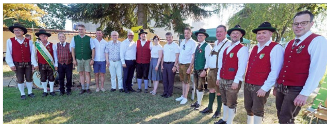
Gastgeber und Ehrengäste nach dem kurzen Festakt mit einem Monsterkonzert mit hunderten Musikerinnen und Musikern auf der schattigen Pfarrwiese anlässlich des diesjährigen Blasmusikbezirksfests mit Marschmusikwertung des Blasmusikverbands Fürstenfeld in Söchau.

Offizieller Höhepunkt des zweitägigen Musikevents war ein kurzer Festakt auf der schattigen