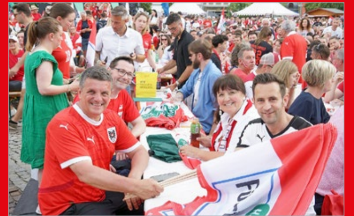
Am Fürstenerfelder Hauptplatz ging beim WM-Schlagerspiel Österreich gegen Argentinien ein stimmungsgeladenes Fußballfest in Rot-Weiß-Rot über die Bühne.