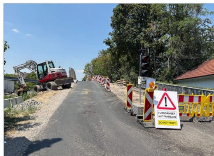
Die Brücke, wichtiges Bindeglied zwischen Stadt und Mühlbreiten, wird heuer grundlegend saniert. Aktuell sind die Bauarbeiten an der LKH-seitigen Fahrbahn noch in Gang.

Vor 70 Jahren wurde die Eselsbrücke als verkehrsstrategisch wichtiges Bindeglied zwischen der Stadt und dem Stadtteil Mühlbreiten errichtet, nach sieben Jahrzehnten wurde nun eine grundlegende Sanierung dringend notwendig. Die Stadtgemeinde investiert in die Ertüchtigung der Brücke rund 300.000 Euro.