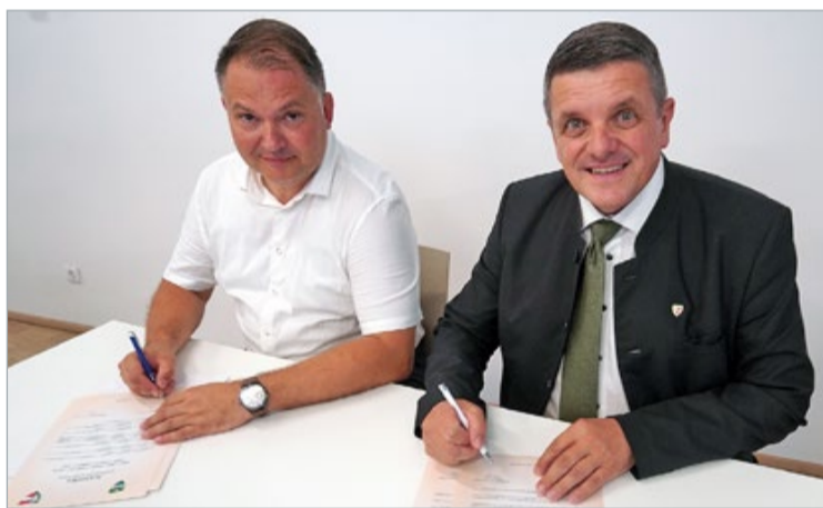
Murska Sobotas Bürgermeister Damjan Anželj und Fürstenerfelds Bürgermeister Franz Jost (v.l.) bei der Unterzeichnung der Absichtserklärung, die gemeinsame Kooperation zu fördern.

besondere auch in der Verwaltung, in der Kunst und Kultur sowie im Sport soll der Erfahrungsaustausch unter Einbeziehung verschiedener Organisationen und Vereine gefördert und intensiviert werden.