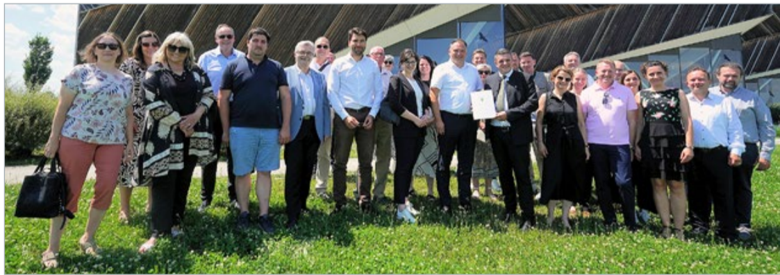
Einen sehr herzlichen Empfang gab es für die Fürstenerfelder Delegation im Freizeitpark „Expano“ in der Stadtgemeinde Murska Sobota in Slowenien. Dabei kam es zum freundschaftlichen Austausch und zur Beurkundung einer künftigen Zusammenarbeit der beiden Städte.