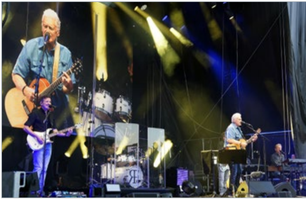
Reinhard Fendrich überzeugte mit seinen großen Hits genauso wie mit selten gespielten Klassikern oder Songs aus seinem jüngsten Album „Nur ein Wimpernschlag“ bei seiner bejubelten Performance am Fürstenfelder Hauptplatz.