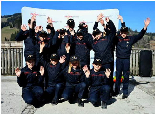
Die Feuerwehrjugend der FF Pischelsdorf bestand den Wissenstest in Heilbrunn erfolgreich.

Ein Dank gilt außerdem der Freiwilligen Feuerwehr Heilbrunn für die Organisation sowie allen Bewertern für die reibungslose Durchführung des Wissenstests.