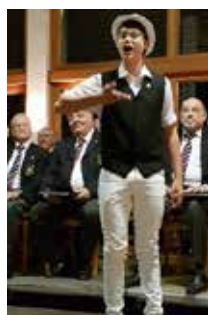
MGV Konzert 2017