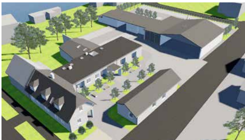
Auszug aus der Machbarkeitsstudie „Gesundheitszentrum Pottenstein“ © DI Michael Maurer

Einen konkreten Zeitplan für die Durchführung kann ich aufgrund der aktuellen Planungsschritte noch nicht endgültig bekanntgeben. Ich freue mich aber bereits jetzt, Ihnen dieses wichtige und zukunftsorientierte Projekt bald detaillierter vorstellen zu können.