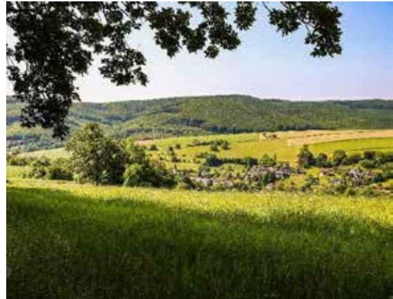
Im Wienerwald wechseln große Waldflächen mit Wiesenlandschaften.