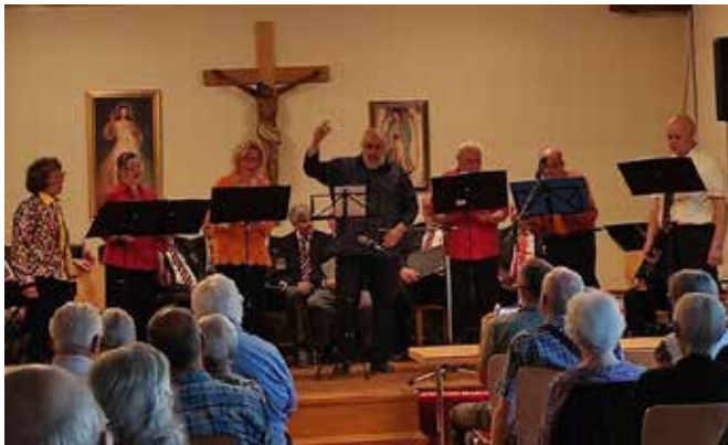
Ensemble des Chores Berndorf – Veitsau

Unter dem Titel „Lieder im Frühling“ gestaltete der Männergesangsverein Pottenstein mit dem Chor Berndorf – Veitsau am 18. Juni 2025 im Pfarrsaal Pottenstein ein beschwingtes Gemeinschaftskonzert.