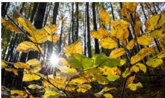
Buchenwälder, wie sie in Mitteleuropa in dieser Ausdehnung kaum noch zu finden sind, prägen große Waldbereiche des Wienerwaldes.

Die naturschutzfachliche Bedeutung des Wienerwaldes kommt nicht nur durch die Ausweisung als Europaschutzgebiet, sondern auch durch das UNESCO-Prädikat Biosphärenpark zum Ausdruck. Dieses ist beinahe deckungsgleich mit der Europaschutzgebietskulisse. Weiters finden sich im Gebiet 16 Naturschutzgebiete, die überwiegend als Biosphärenpark-Kernzonen ausgewiesen sind.