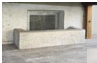
Kleine Mauern bei Kellerfenstern bieten schon gewissen Schutz.

Zahlreiche weitere Tipps finden Sie auf www.zivilschutz.steiermark.at