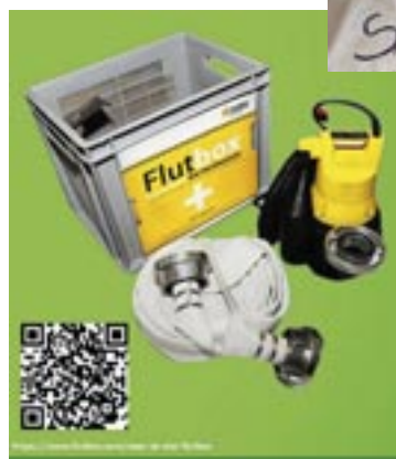
Bei Überflutung des Kellers hilft z.B. die Flutbox. www.flutbox.com